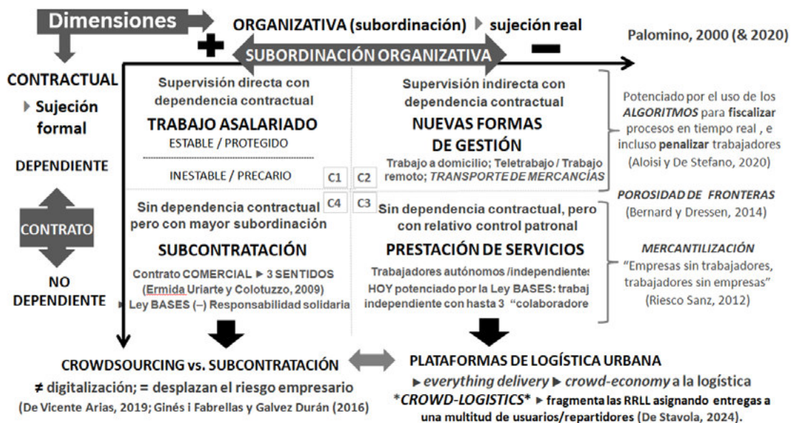
Figura 1. Articulación de las dimensiones analíticas propuestas