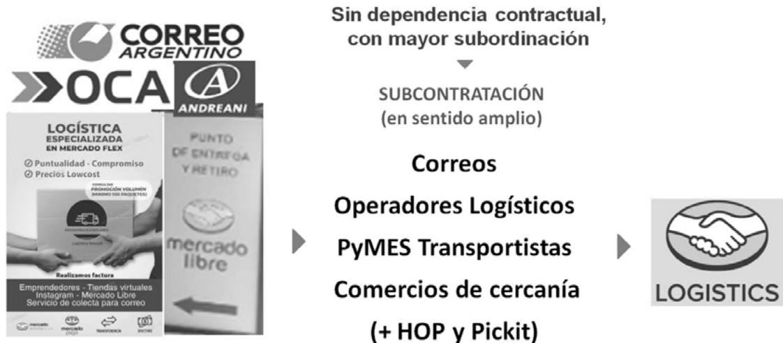
Figura 3. La red de subcontratación en Logistics