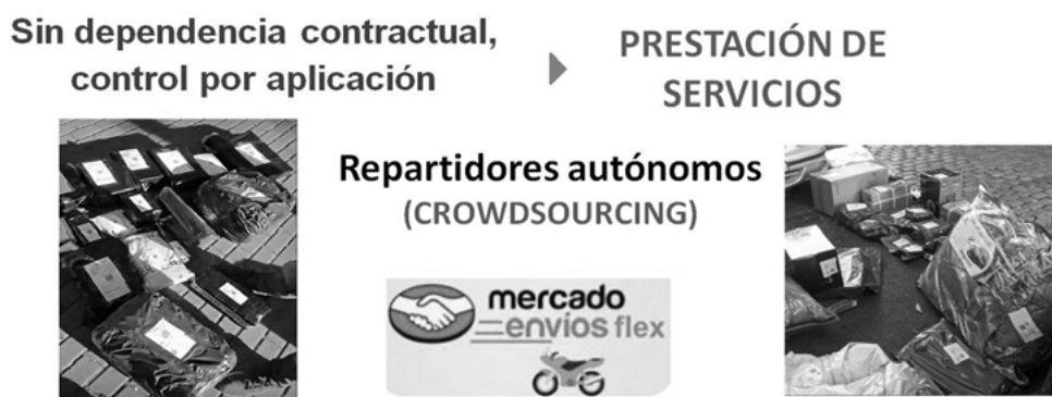
Figura 4. La prestación de servicios flex en la red