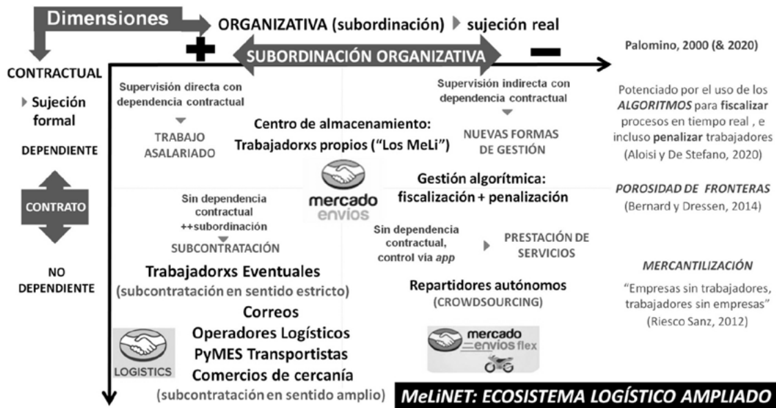
Figura 5. Sistematización de los resultados