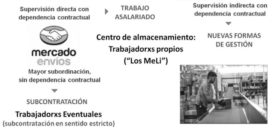
Figura 2. Los vínculos contractuales en MercadoEnvíos