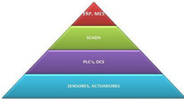
Figura 18 Pirámide de Automatización