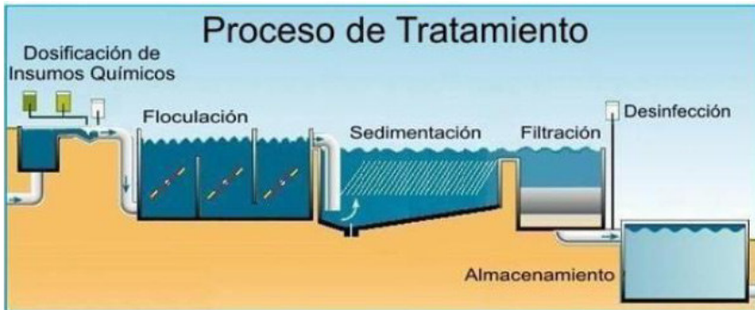
Figura 17. Proceso de una planta de tratamiento de agua potable