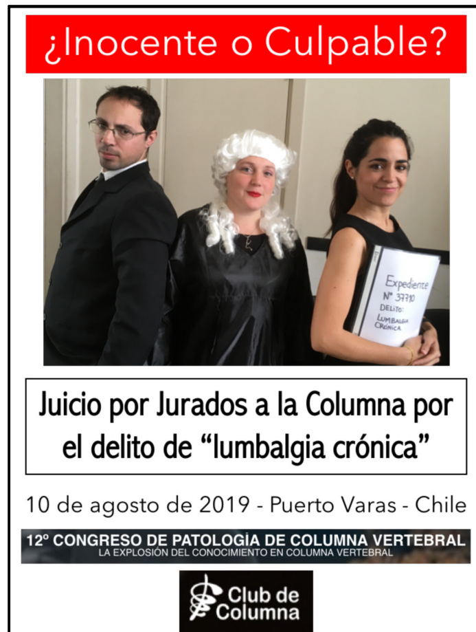
Flyer de presentación de la obra en el 12° Congreso de Patología de la Columna Vertebral, Chile, agosto de 2019.