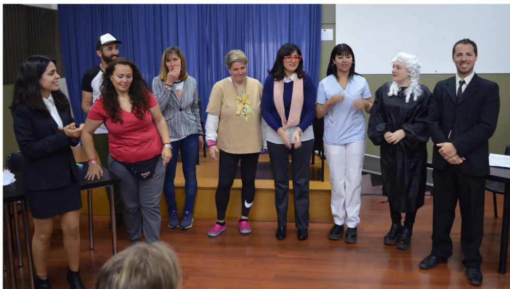
Universidad Gran Rosario, septiembre de 2019