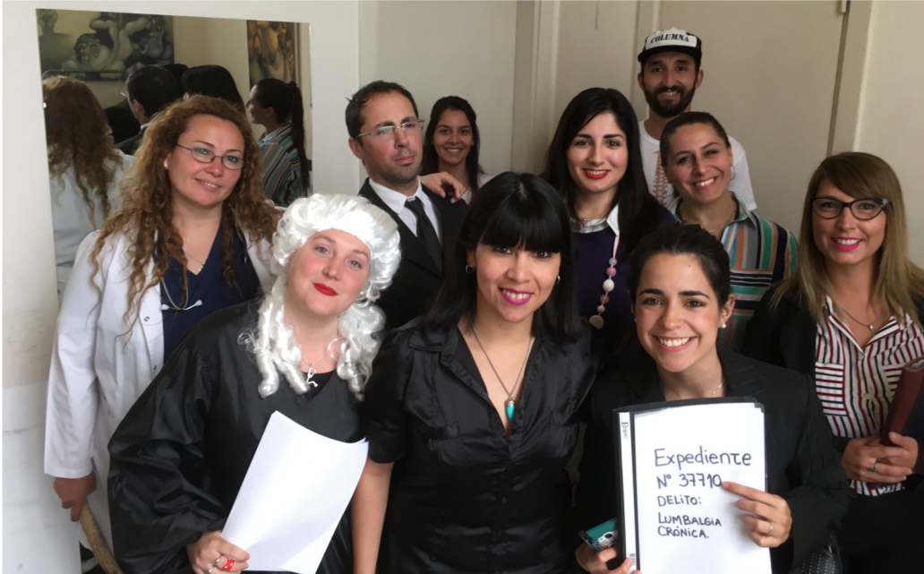
Auditorio Universidad Nacional Arturo Jauretche, octubre de 2018