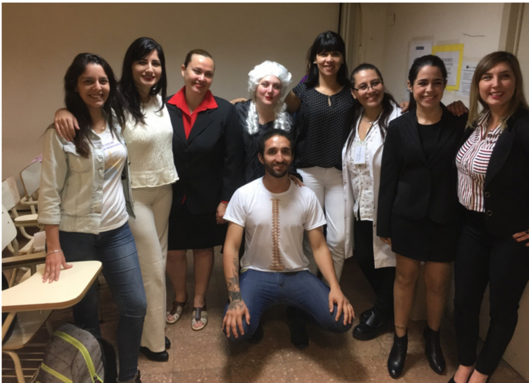
Universidad de Buenos Aires, noviembre de 2018