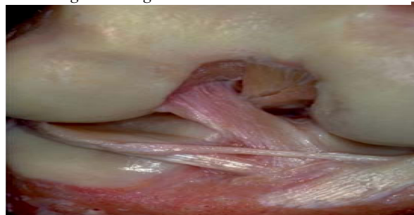
Figura 1: Ligamento cruzado anterior

El LCA es una estructura, que se puede llamar visco elástico, con mínimas variaciones de longitud en los movimientos articulares de la rodilla, con presencia de mecano receptores y vasos de pequeño diámetro. A su vez está compuesto por dos o tres fascículos independientes desde el punto de vista anatómico y biomecánico, por lo que su reconstrucción debe mantener y respetar la longitud de sus fibras, además de facilitar su reparación biológica y de la propioceptividad. (11)