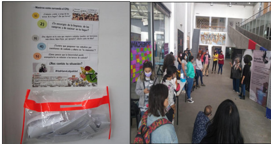
Imagen Nº 1 (izq.): Afiche sobre la temática y sobre-urna para depositar las preguntas. Imagen Nº 2 (der.): Desarrollo de la intervención artística durante las actividades del 8M 2022 (Edificio Savio, Unaj).

En septiembre de 2022 se realizaron entrevistas grupales (de 2 horas a 2 horas y media de duración cada una) dirigidas a estudiantes que cuidan. Esta actividad estuvo orientada a trabajar sobre representaciones y percepciones en torno a los cuidados de estudiantes que contaban con trayectoria en la universidad haciendo especial énfasis en el debate sobre los cuidados en relación con las estrategias institucionales existentes para favorecer un primer diagnóstico acerca del impacto que las tareas de cuidado tienen en las trayectorias de los estudiantes. Trabajamos con una dinámica de situación e incluimos, una pregunta sobre cómo imaginan a la universidad en 5 años en relación con las temáticas abordadas.